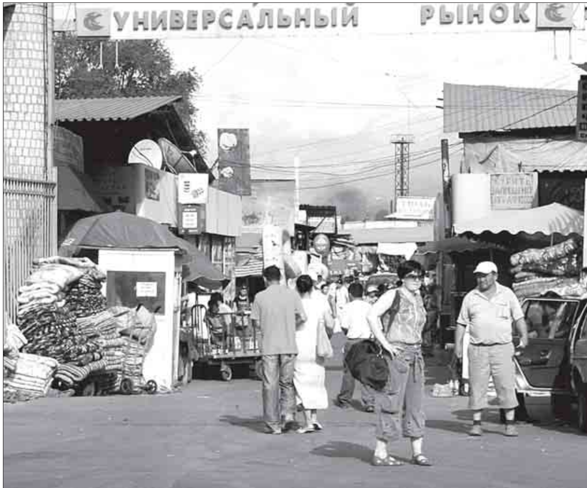
ВЕЛИКОЙ достопримечательности южной столицы - многокилометровой барахолке - скоро придет конец, утверждают эксперты.

— Это не экономический, а политический союз, и сразу видно, какой стране это выгодно, — уверен бизнесмен Жу-