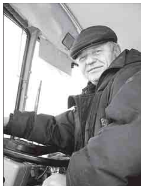
УЛЫБКА водителя излучает здоровье.