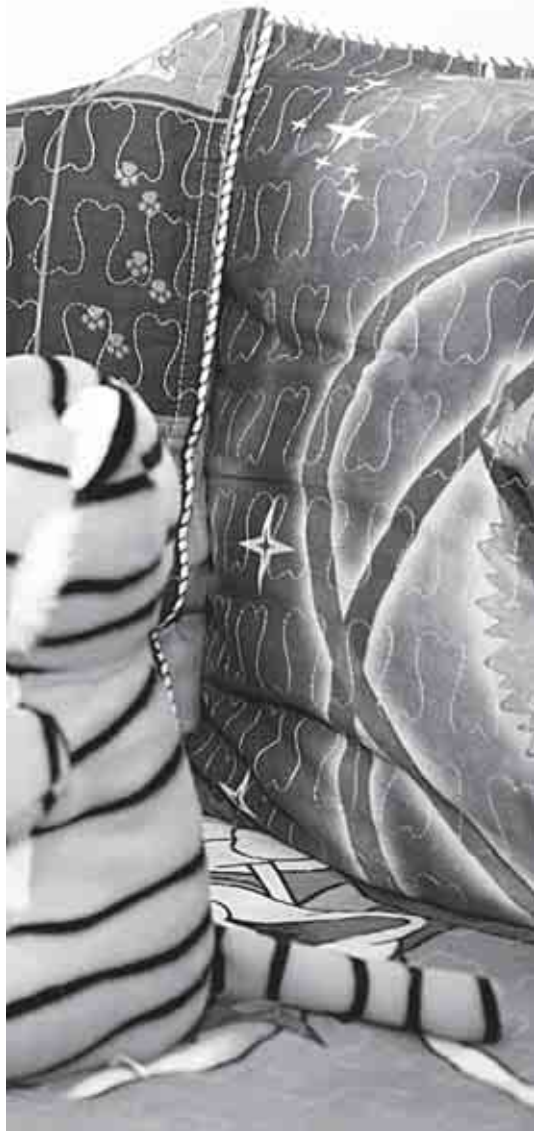
внимания, сказали, что это, возможно, бно пополняет свою копилку.

Этот случай далеко не уникальный, уверены дачники, единственное, что их удивляет, – почему с председателем садоводческого общества ни прокуратура, ни акимат, ни финпол (вместе взятые) справиться не в состоянии.