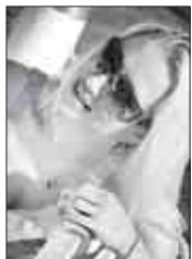
БЛОНДИНКА В ЗАКОНЕ