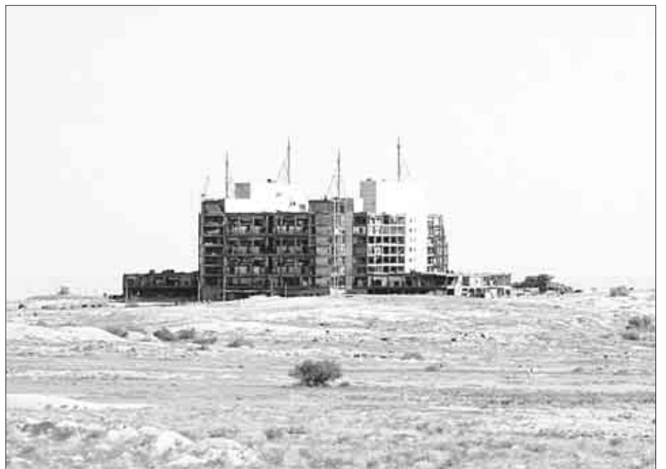
ЭТОТ “УТЛЫЙ КОРАБЛЬ” стоил министру экологии свободы.

Прежде на станции располагалось 16 000 конденсаторов. После того как станция перестала функционировать, конденсаторы стали источниками загрязнения окружающей среды. На республиканском уровне была разработа-