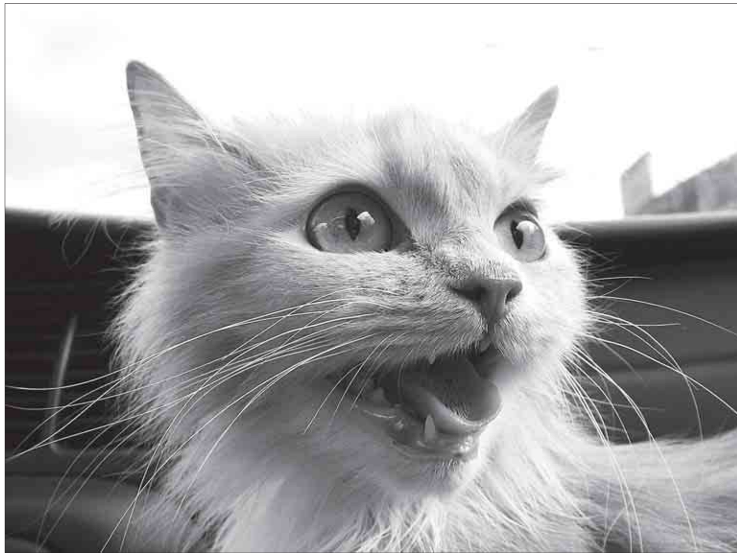
ВАША КОШКА так реагирует на еду? Скорее всего, это ГМО.