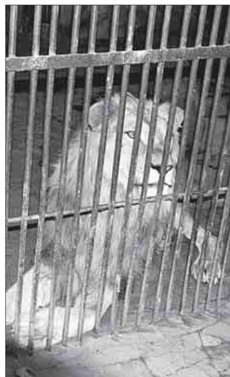
ЛЬВИЦА Нафа устала от скандала.