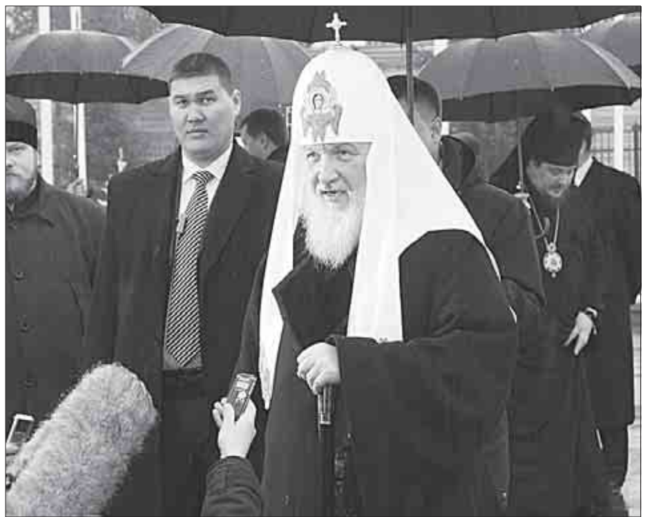
ПАТРИАРХ рассказал, кого надо благодарить за мир в Казахстане.

За время визита патриарх принял участие в Божественной литургии, проходящей в Вознесенском кафедральном соборе, а также отдал дань памяти погибшим в Великой Отечественной войне в честь предстоящего в этом году празднования 65-летия Победы. В понедельник он возложил венок у мемориала Славы в парке имени 28 гвардейцев-панфиловцев в Алматы.